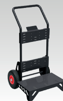
Carrinho de transporte 039568