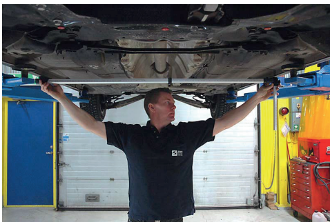
Controlo do nível do veículo