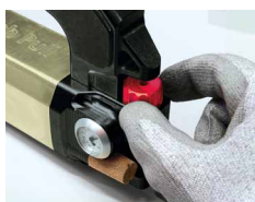
Druk instellen van 0 > 6.5 bar