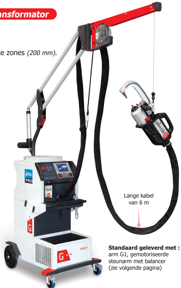
Lange kabel van 6 m

Standaard geleverd met : arm G1, gemotoriseerde steunarm met balancer (zie volgende pagina)