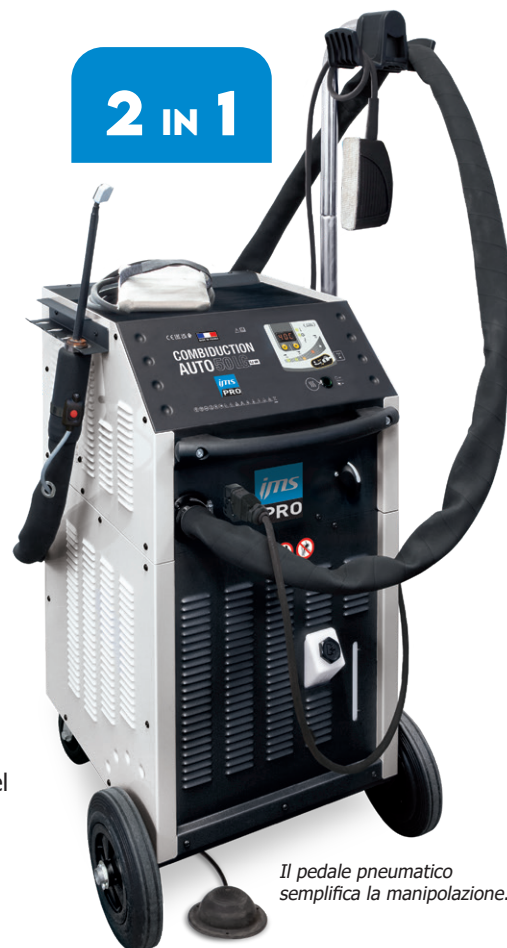
Il pedale pneumatico semplifica la manipolazione.