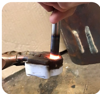
Trempe axe acier