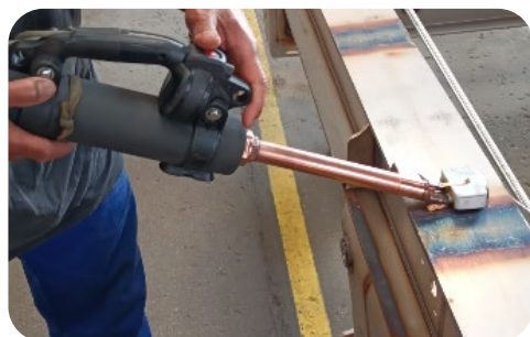
Raddrizzamento su telai in acciaio inox/acciaio