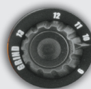
Tinta 9>13 e pantofolai