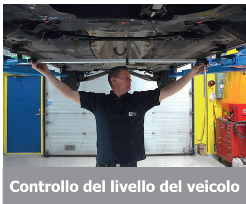
Controllo del livello del veicolo