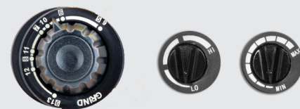
Оттенок 5>13 Чувствительность Крайний срок и режим шлифовки