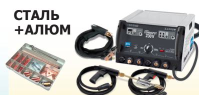
SMARTLINER Combi 230V - Арт. 036093