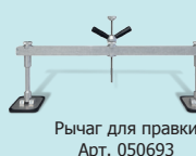
Рычаг для правки Арт. 050693