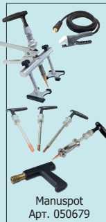
Manuspot Арт. 050679