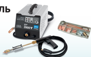
SMARTLINER 3900 - 230V - Арт. 034938 SMARTLINER 3900 - 400V - Арт. 034945