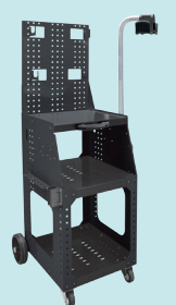
Тележка Spot Pro XL Арт. 034259