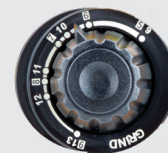
Tinta 5>13 e modalità di rettifica