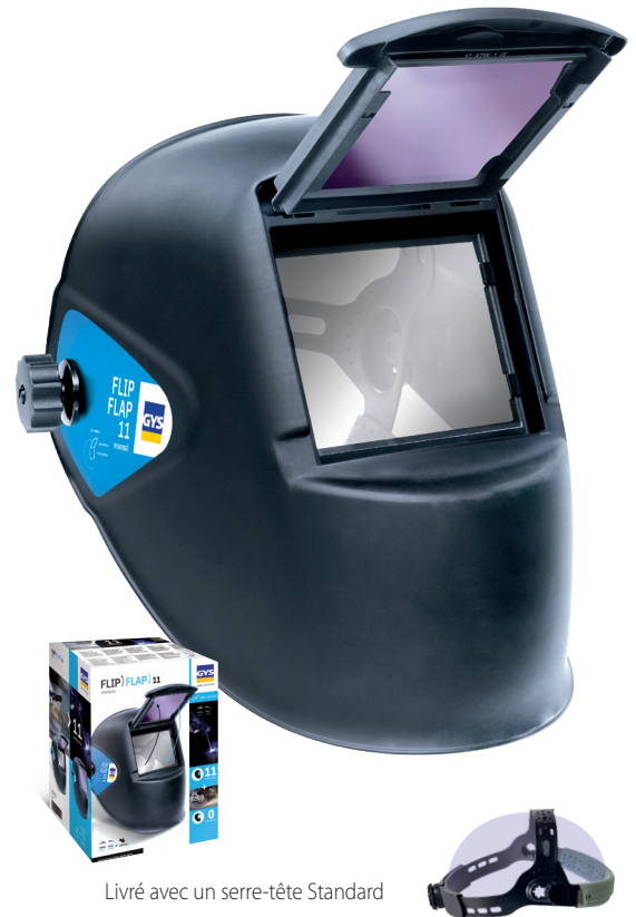
Livré avec un serre-tête Standard