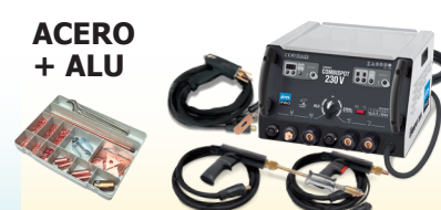
SMARTLINER Combi 230V - ref. 036093