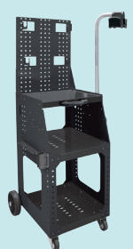
Carrito Spot Pro XL ref. 034259