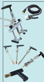
Manuspot ref. 050679