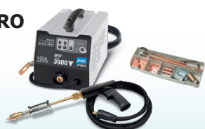
SMARTLINER 3900 - 230V - ref. 034938 SMARTLINER 3900 - 400V - ref. 034945