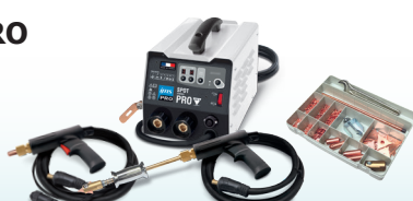
SMARTLINER PRO 230 - ref. 036161 SMARTLINER PRO 400 - ref. 035713